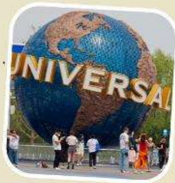
5 UNIVERSAL BEIJING