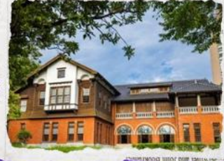
พิพิธภัณฑชาติน้ำพุร้อน