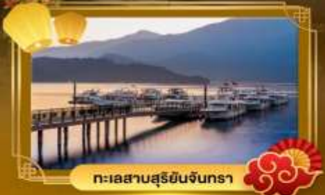
ทะเลสาบสุริยจันทร์