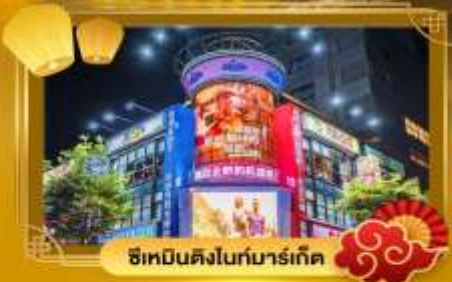
ช้อปปิ้งในทงมาร์เก็ต