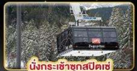
นั่งกระเช้าชุกสปีตซ์