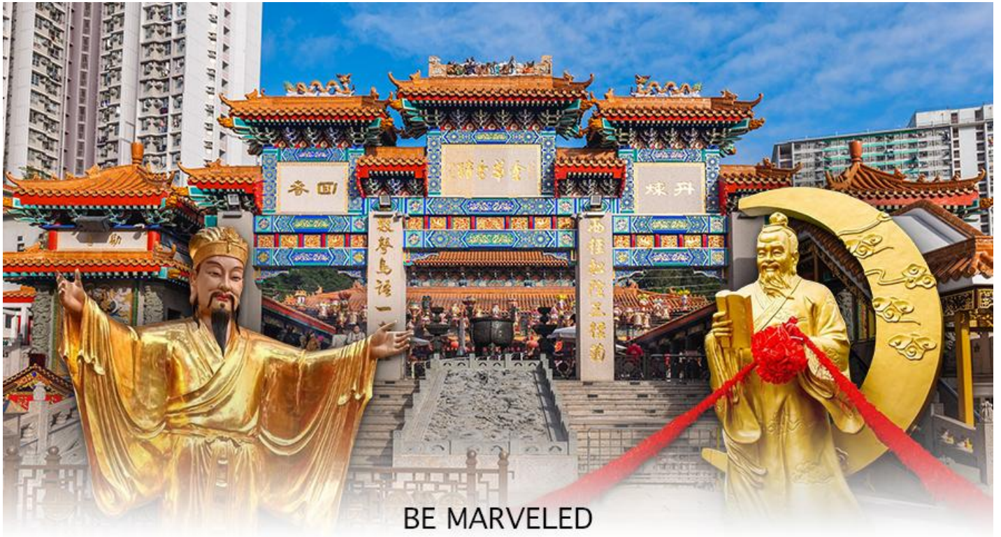
BE MARVELED วัดหวังต้าเซียน

อย่างยิ่งคือ เทพเจ้าหยุก โหลว หรือ เทพเจ้าแห่งความรัก ที่เราเรียกกันว่า เทพเจ้าด้ายแดง เป็นพิภพที่หลายๆ คนมักจะไปขอความรักจากท่านกัน นอกจากนี้ที่เราจะต้องเอาด้ายแดงมาพันมือนี๊ ตามป้ายที่แนะนำข้างหน้าแล้ว ไกด์นำเที่ยวคนฮ่องกงบอกมาว่าถ้าเป็นผู้หญิงอย่างเราอยากได้แฟน ก็ต้องไปผูกด้ายที่รูปปั้นผู้ชายและพอไหว้เสร็จแล้วก็อย่าลืมหยอดทำบุญใส่ตู้ไปด้วย