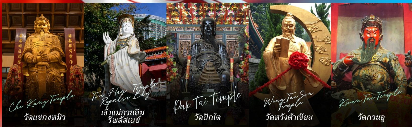
Che Kung Temple วัดแชกงทมิว

รายการทัวร์ข้างต้นอาจมีการปรับเปลี่ยนเพื่อความเหมาะสม