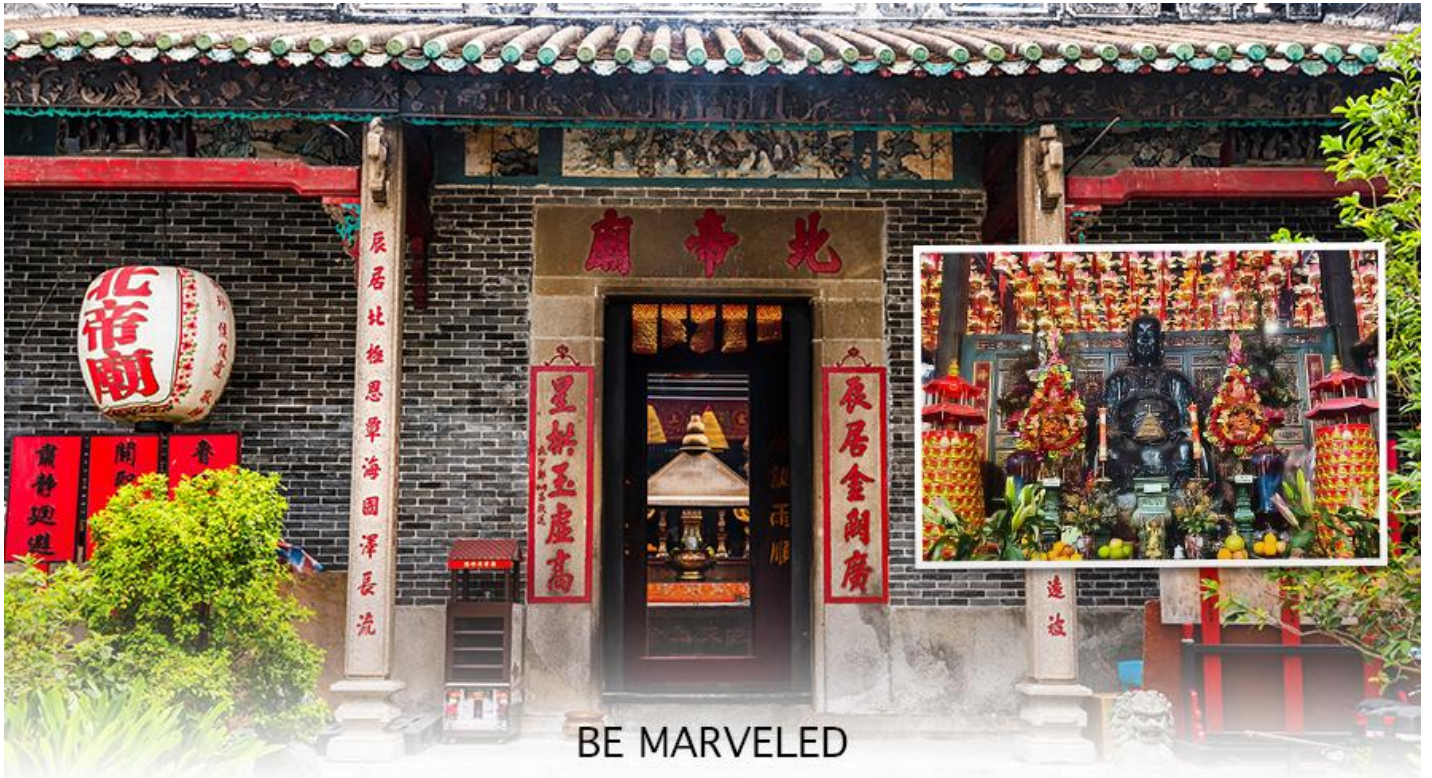
BE MARVELED วัดปักไต้

แห่งท้องทะเล ในลัทธิเต๋า และชาวฮ่องกงเชื่อกันว่าผู้ใดที่เกิดปีชง หากมาทำการแก้ดวงชะตาแก้ชงประจำปีที่วัดนี้ จะทำให้ร้าย กลายเป็นดีได้ และที่วัดยังมี “เทพเจ้าเปลี่ยนใจ” ที่นิยมมาขอพรให้เรื่องที่ไม่ดี กลายเป็นเรื่องดีหรือ คนที่เป็นศัตรูของเราเปลี่ยนใจมาเป็นมิตร เป็นที่นิยมอย่างมากของชาวท้องถิ่นฮ่องกงมากราบไหว้ขอพรกันที่วัดนี้