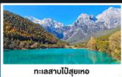
ทะเลสาบโป๋ส่วยเหอ