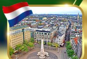
จัตุรัสดีนสแควร์ อัมสเตอร์ดัม