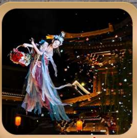
“เมืองโบราณลั่วอี้”

ชมถ้ำหลงเหมิน มรดกโลกที่เมืองลั่วหยาง • สุสานจีนซีฮ่องเต้ • ศาลเจ้ากวนอู วัดเส้าหลิน + ป่าเจดีย์ + ชมโชว์กังฟู • เมืองโบราณลั่วอี้ • อุทยานหยุนไท่ซาน เจดีย์ห้าพันปี • ถนนวัฒนธรรมต้าถัง • ถนนคนเดินอิสลาม • จัตุรัสหออระขิง