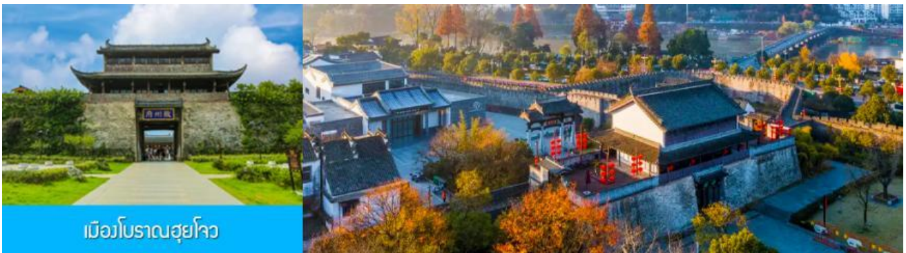
เมืองโบราณซูโจว

จากนั้นนำท่านเดินทางโดยรถบัสสู่ เมืองโบราณซูโจว (ระยะทาง 149 กม. ใช้เวลาเดินทางราว 2 ชั่วโมงเศษ)