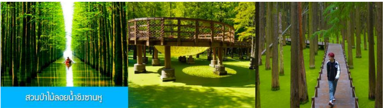
สวนป่าไผ่ลอยน้ำชิงชานหู

พักที่ โรงแรม Holiday Inn Express Hotel 4* หรือเทียบเท่าในนครเซี่ยงไฮ้