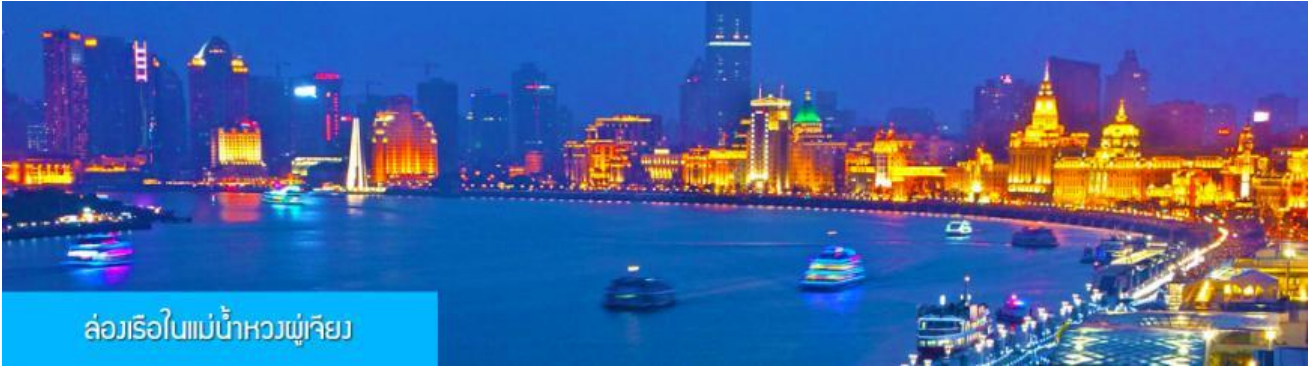
ล่องเรือในแม่น้ำหวงผู่เจียง