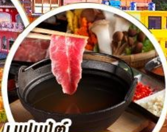
บุฟเฟ่ต์ ซาบูทหม้อไฟไต้หวัน