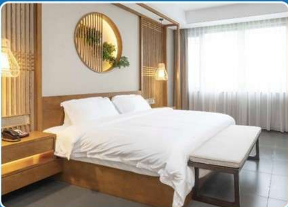
👤👤 DOUBLE (DBL)