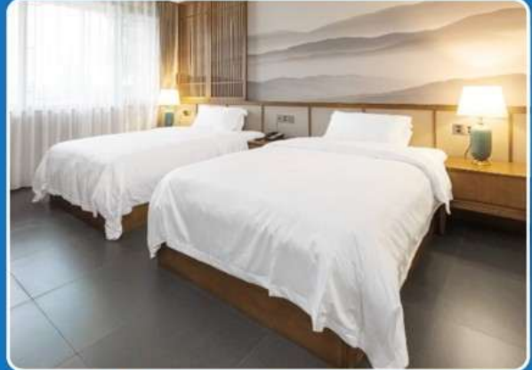
👤👤 TWIN (TWN)