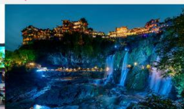
ฝูหรงเจิน

*ทางบริษัทฯ ขอสงวนสิทธิ์ในการสลับโปรแกรมทัวร์ตามความเหมาะสมขึ้นอยู่กับสถานการณ์หน้างาน โดยคำนึงถึงผลประโยชน์ของลูกค้าเป็นสำคัญ