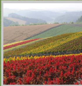
"SHIKISAI NO OKA"