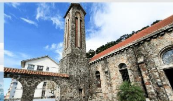
โบสถ์หินตามด้าว