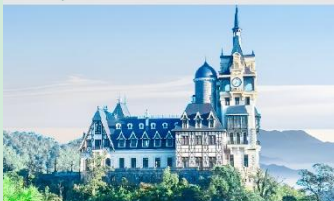
ปราสาทตามด้าว