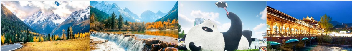
ภูเขาสีดรุณี (หุบเขาชวงเจียวโกว)