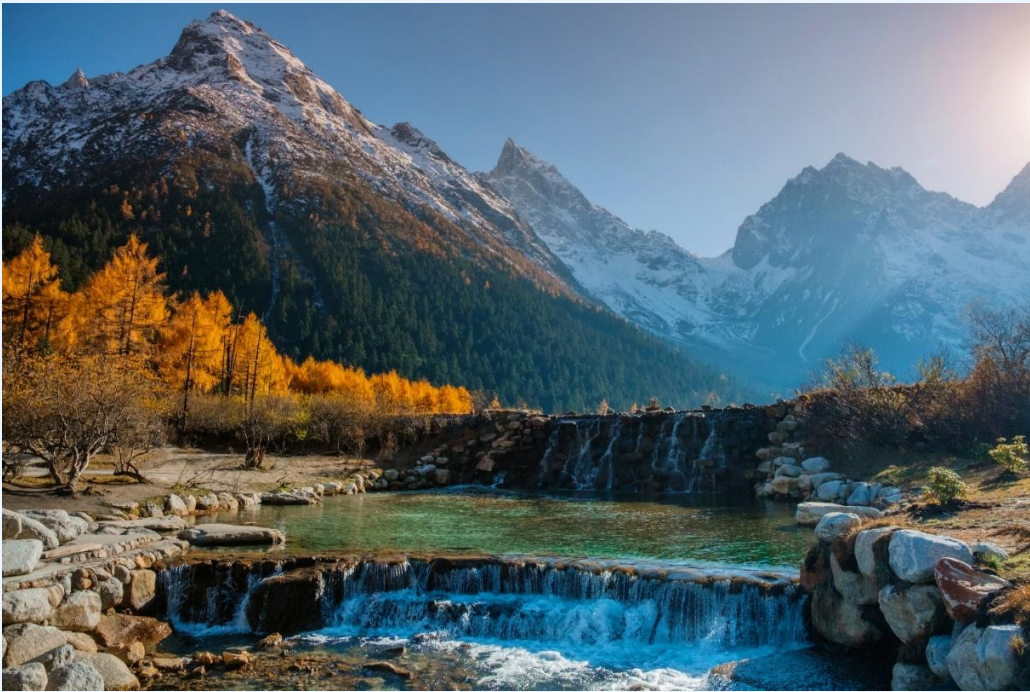
ฤดูใบไม้ร่วง (AUTUMN)