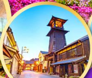
หอรบั้งโทคิโนะคาเนะ