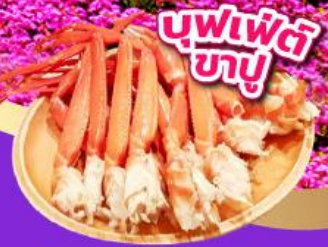
บุฟเฟ่ต์ขาปู