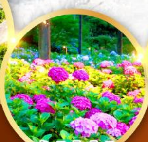
วัดมิมุโระโทจิ