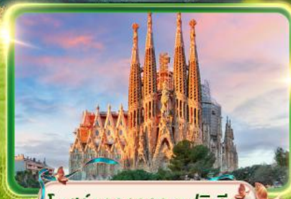
โบสถ์ซากราดา แฟมิลีย