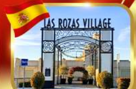
Las Rozas Village ฮาที่ลีน