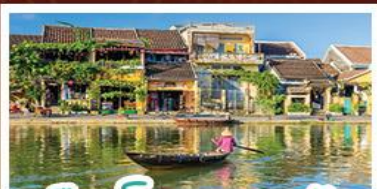
เมืองโบราณเฮออัน

! พักบนเขานาฮิลล์ 1 คืน ! สัมผัสอากาศเย็นตลอดปี สตรีตฝรั่งเศสสุดคลาสสิก - นั่งกระเช้ายาวที่สุด สูบานาฮิลล์ สนุกสุดมันส์ไปกับสวนสนุก The Fantasy Park มนัสการเจ้าแม่กวนอิมองค์ใหญ่ที่สุดของเมืองดานัง - เช็กอินเมืองมรดกโลกฮอยอัน - สนุกสนานไปกับกิจกรรม!!นั่งเรือกระดิง หมู่บ้านกัมถาน เช็กอินร้านกาแฟ SON TRA MARINA CAFE - ไม่หลงร้านช้อปปิ้ง - อิ่มอร่อยกับบุฟเฟ่ต์นานาชาติ , หม้อไฟซีฟู้ด