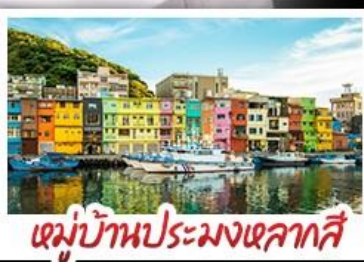
หมู่บ้านประมงเหลากสี