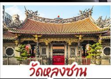
วัดเจหลงซาน