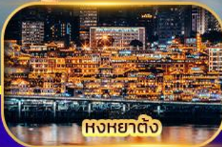
หงหยาดิง