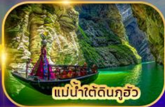
แม่น้ำใต้ดินกุ้ยโจว