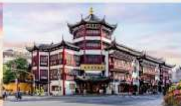
ตลาดร้อยปีเจินหวังเมี่ยว