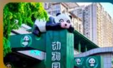
สถานีหมี่แพนด้า