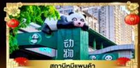
สถานีหมีแพนด้า