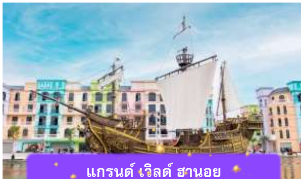
แกรนด์ เวิลด์ ฮานอย