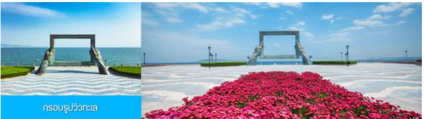
กรอบรูปวิวทะเล

พักที่ Holiday Inn Express Hotel หรือ ระดับมาตรฐาน 4 ดาว ท้องถิ่น