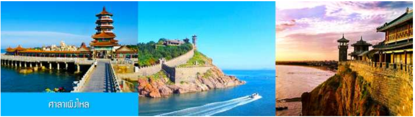
ศาลาเพิงไหหล

หลังอาหารนำท่านเดินทางสู่เมืองเพิงไหหล ชม ศาลาเพิงไหหล ดินแดนแห่งเทพเซียน และเป็นหนึ่งในสี่สถาปัตยกรรมโบราณที่งดงามของจีน ซึ่งตั้งอยู่ริมทะเล ( ชมด้านนอก ) นำท่านชมซุ้มประตูเพิงไหหล พระราชวังมังกร พระราชวังราชินีแห่งสวรรค์ และศาลาหลัก ชมทัศนียภาพอันตระการตาของเขตแดนทะเลเหลือง-ทะเลป้อไห่ ชม " ศาลาอมตะทะเลย่นตู้ทงฟ้า " จากนั้นนำท่านเดินทางไปยัง จุดชมวิวแปดเซียนข้ามทะเล ชมสถานที่สำคัญอันเป็นสัญลักษณ์ เช่น หอคอยเซียนหยวน กำแพงแปดเซียน และศาลาขู่เซียน โครงสร้างรูปทรงน้ำเต้าที่ล้อมรอบด้วยทะเลทั้งสามด้าน เชื่อมโยงตำนานแปดเซียนเข้ากับ ความมหัศจรรย์ของภาพลวงตา