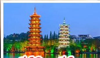
เจดีย์เงินเจดีย์ทอง