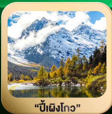
“ปี่ผิงโกว”

ชมธรรมชาติ 2 อุทยานขึ้นชื่อ อุทยานภูเขาสี่ครุณี + อุทยานปี่ผิงโกว สะพานหนานเฉียว • ถนนคนเดินไท่กู่หลี่ + ซุนซีลู่ + Pop Mart • ดงเจียวจื่อ