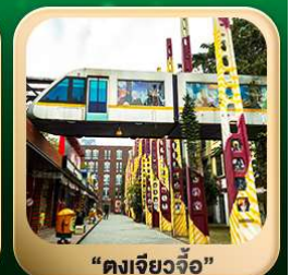
“ดงเจียวจื่อ”