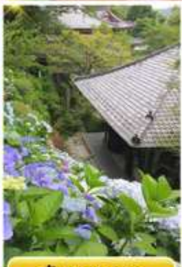
วัดฮาเซเดระ