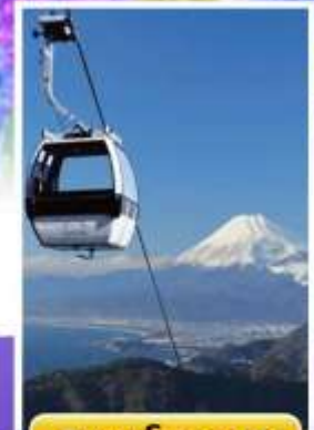
อิซุพานรามาวิว