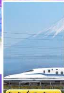
สัมพัสนั่งชินคันเซน