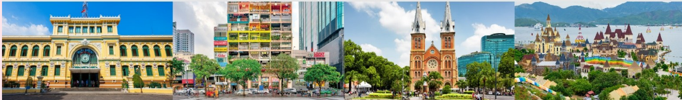
ไพรบ์นีย์กลางโฮจิมินห์