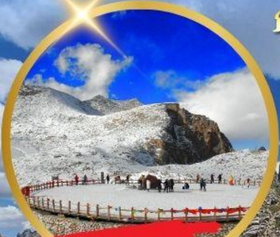
OPTIONAL TOUR ธารน้ำแข็งต่ากู่ปิงชวน