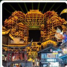
ตึกหอคจรรย 72