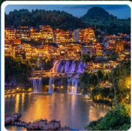
ฟูรงเจิน