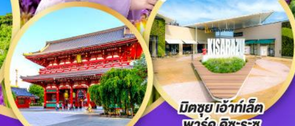
มิตซูโฮะอิเกะ ลีต พาร์ค คิชะระชู