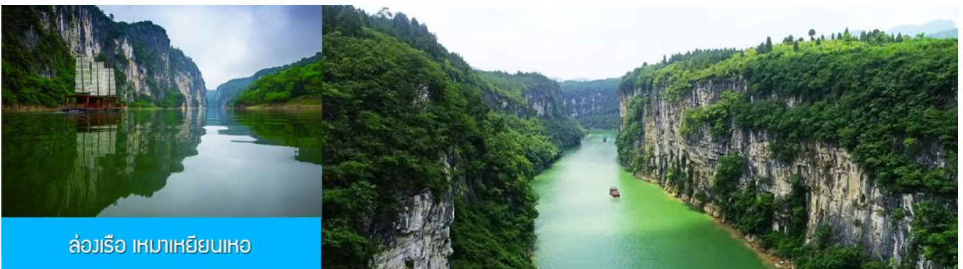
ล่องเรือ เหมาเหยียนเหอ