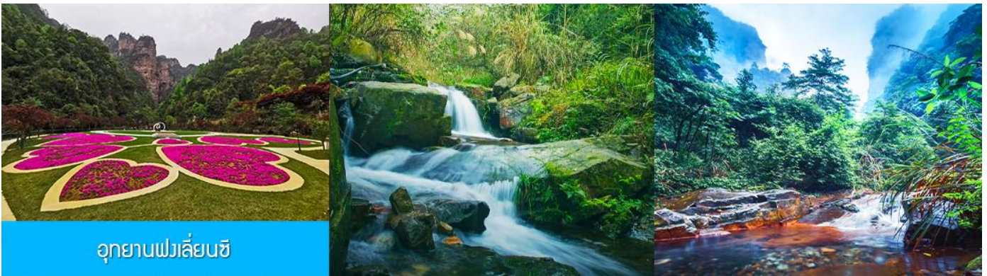
อุทยานฟงเลียนซี