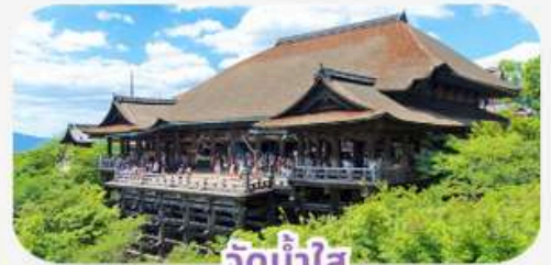
วัดน้ำใส