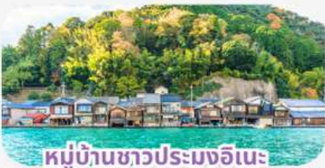
หมู่บ้านชาวประมงอิเนะ