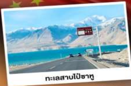
ทะเลสาบไปซาทุ

“ซินเจียงใต้” ดินแดนแห่งทะเลทราย สัมผัสวัฒนธรรมของชาวซินเจียงอุยกูร์