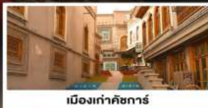
เมืองเก่าคัชการ์