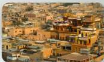
เมืองเก่าคีชการ์