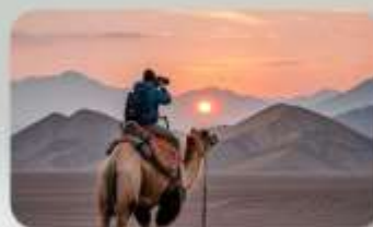
ทะเลทรายทากลามากัน