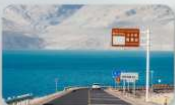
ทะเลสาบไป่ซาหู่