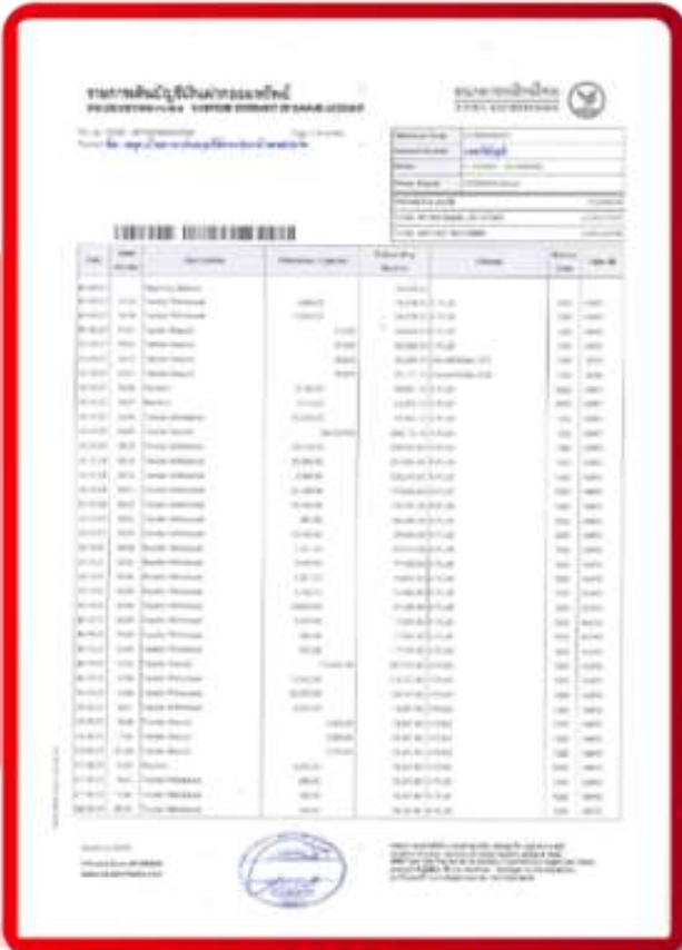
ตัวอย่าง Bank Guarantee ที่ผู้สมัครต้องยื่นธนาคาร