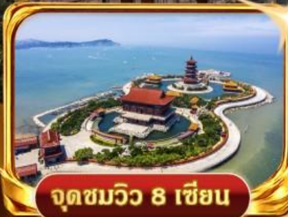
จุดชมวิวกว 8 เซียน