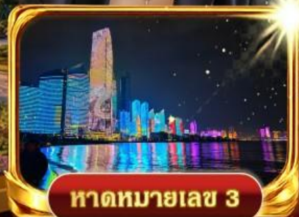
หาดหมายเลข 3