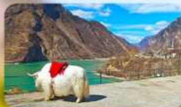
กะเลสาบเต๋อซี