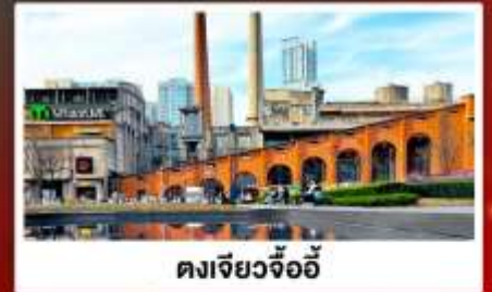
ตงเจียวจ้ออ๋