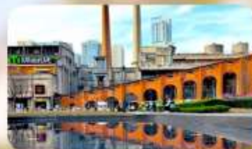
ตงเจียวจื่ออี้