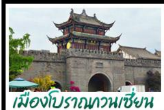
เมืองโบราณทวนเซี่ยน

ภูเขาสิ่ตฺรุณี - อุทยานป่ฝิงโกว - สะพานหนานเฉียว - ร้านหนังสือจงซูเก๋ - เมืองโบราณกวนเสียน จตุรัสหย่างเทียนหัว - หมู่แพนด้าซาฟี่ - ถนนโบราณชอยกว้างชอยแคบ - ถนนคนเดินไถ่กู่หลี่ ถนนคนเดินซุนซี - ถนนโบราณจิ้นหลี่ - แพนด้ายักษ์ปิ่นตึก - น้ำพุไม้ไผ่ตึกSKP - วัดต้าฉือ