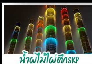
น้ำพุไม้ไผ่ตึกSKP