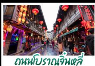
ถนนโบราณจิ้นหลี่