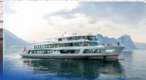
ล่องเรือทานอาหารกลางวัน ทะเลสาบลูเซิร์น