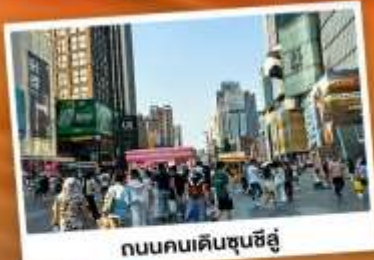
ถนนคนเดินชุนชี่ฮู