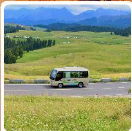
ทุ่งหญ้าเจียนปูลาเค่อ