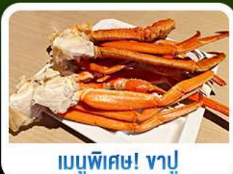
เมนูพิเศษ! ขาปู

เกาะเอโนะชิมะ วิวสวยงามติด 1 ใน 100 ภูมิทัศน์ญี่ปุ่น พร้อมขอพรศาลเจ้าศักดิ์สิทธิ์ เที่ยวเต็มทั้ง 3 วัน แบบจุใจ ทั้งวัด ศาลเจ้า สวนดอกไม้ และช้อปปิ้ง