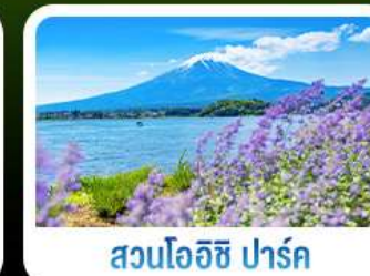
สวนโอะอิชิ ปาร์ค