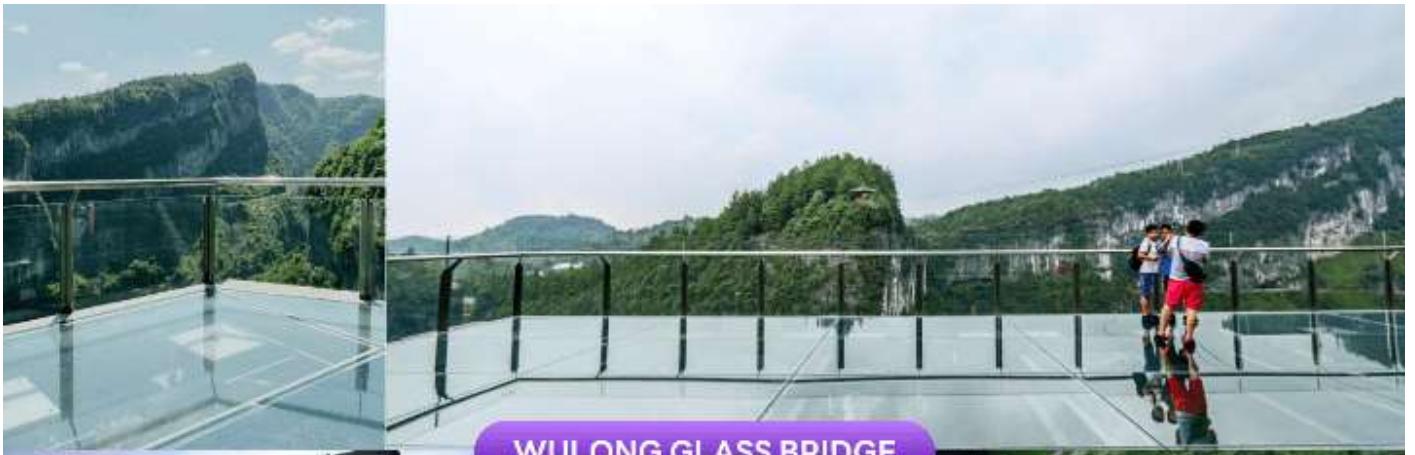
WULONG GLASS BRIDGE