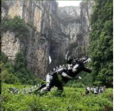
THREE NATURAL BRIDGE