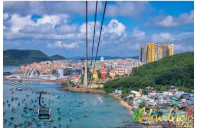
Sun World Hon Thom Nature Park พบกับ

เดียวของเวียดนาม (สำหรับท่านที่สนใจเล่นสวนน้ำ กรุณาเตรียมชุดสำหรับเล่นน้ำ 1 ชุด)