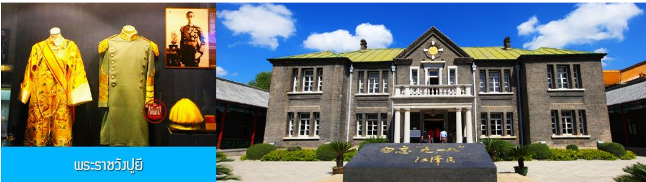
พระราชวังปู้ยี้

รับประทานอาหารเช้า ณ ห้องอาหารของโรงแรม (7)