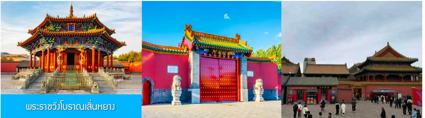
พระราชวังโบราณเสิ่นหยาง

จากนั้นนำท่านเดินทางสู่ เมืองเสิ่นหยาง 沈阳 (ระยะทาง 280 กม. ใช้เวลาเดินทางราว 3 ชั่วโมงเศษ) เที่ยง รับประทานอาหารกลางวัน ณ ภัตตาคาร (8)