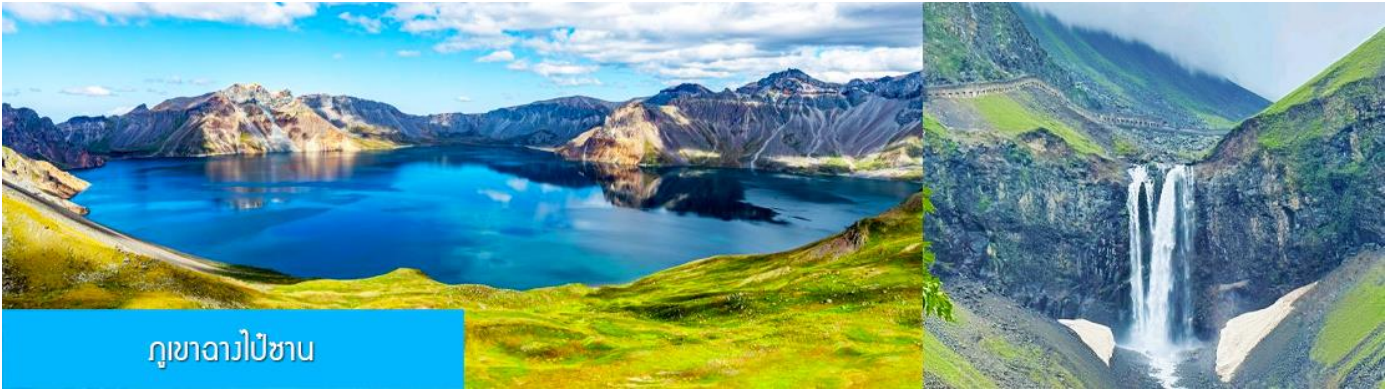
ภูเขาฉางไป่ซาน

หลังอาหารนำท่านเที่ยวชม ยอดเขาฉางไป่ซาน 长白山 (จีน/ลงเนินด้านทิศเหนือ) ชมความงามที่เร้นลับของ ทะเลสาบเทียนฉือ 天池 ที่เชื่อกันว่าเป็นแหล่งน้ำศักดิ์สิทธิ์ที่อยู่ใกล้สวรรค์จนเป็นที่มาของคำว่าเทียนฉือที่แปลว่าทะเลสาบบนสวรรค์ ชม น้ำตกเขาฉางไป่ซาน 长白山瀑布 เป็นน้ำตกที่ไหลลงมาจากหน้าผาขนาดใหญ่ที่มีความสูง 68 เมตร น้ำตกแห่งนี้เป็นจุดน้ำไหลออกของทะเลสาบเทียนฉือ และเป็นต้นกำเนิดของแม่น้ำซงฮัวเจียง....ชม สระน้ำมรกต 绿渊潭 สระน้ำสีเขียวมรกตที่มีน้ำตกน้อยสองสายที่คอยเติมน้ำเข้าไปในสระ เป็น