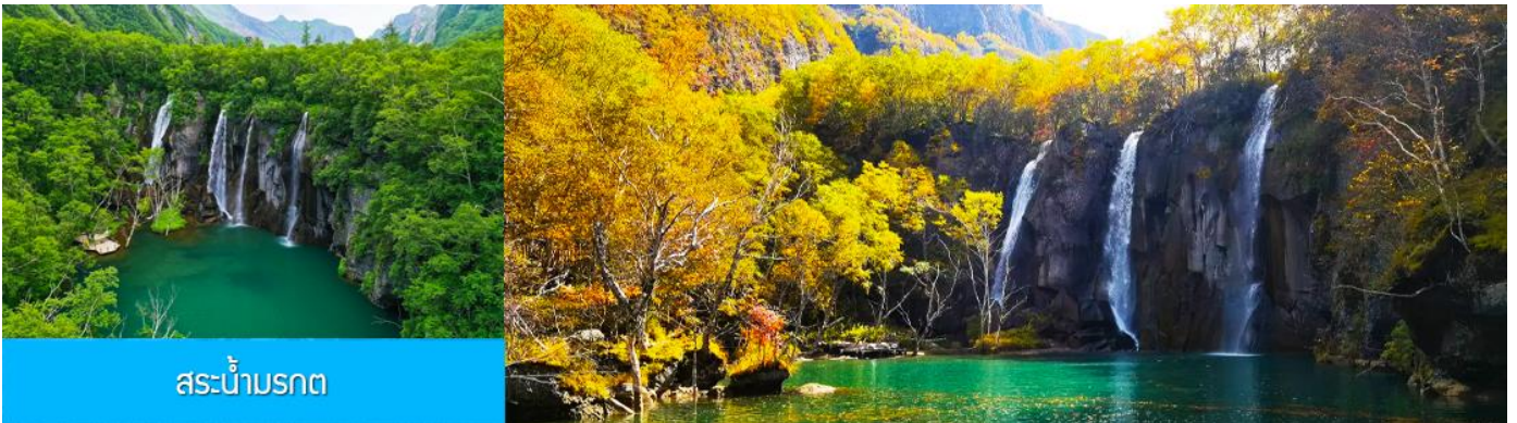
สระน้ำมรกต

หลังอาหารนำท่านเที่ยวชม ยอดเขาฉางไป่ซาน 长白山 (จีน/ลงเนินด้านทิศเหนือ) ชมความงามที่เร้นลับของ ทะเลสาบเทียนฉือ 天池 ที่เชื่อกันว่าเป็นแหล่งน้ำศักดิ์สิทธิ์ที่อยู่ใกล้สวรรค์จนเป็นที่มาของคำว่าเทียนฉือที่แปลว่าทะเลสาบบนสวรรค์ ชม น้ำตกเขาฉางไป่ซาน 长白山瀑布 เป็นน้ำตกที่ไหลลงมาจากหน้าผาขนาดใหญ่ที่มีความสูง 68 เมตร น้ำตกแห่งนี้เป็นจุดน้ำไหลออกของทะเลสาบเทียนฉือ และเป็นต้นกำเนิดของแม่น้ำซงฮัวเจียง....ชม สระน้ำมรกต 绿渊潭 สระน้ำสีเขียวมรกตที่มีน้ำตกน้อยสองสายที่คอยเติมน้ำเข้าไปในสระ เป็น