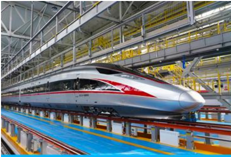
บั้งรถไฟความเร็วสูง