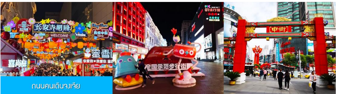
ถนนคนเดินจวงเจีย