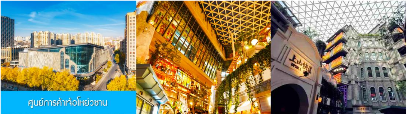
ศูนย์การค้าเจ้อโหย่วซาน

นำท่านเที่ยวชม ศูนย์การค้าเจ้อโหย่วซาน 这有山 แหล่งช้อปปิ้งชั้นนำที่ผสมผสานระหว่างสถานที่ท่องเที่ยว และแหล่งรวมร้านค้า และร้านแนวฟาสต์ฟู้ด อาหารพื้นเมืองร่วมสมัย ภายใต้คอนเซ็ปต์ แหล่งช้อปปิ้งบนภูเขา และบนภูเขามิแหล่งช้อปปิ้ง เป็นจุดเช็คอินยอดนิยมที่เปิดให้คนพื้นที่และนักท่องเที่ยวเข้าชมตั้งแต่ปี ค.ศ. 2019