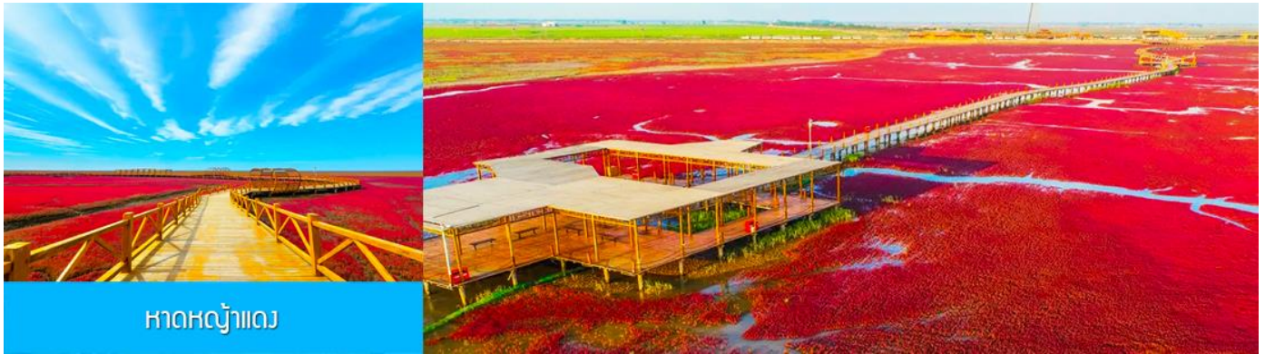
หาดหญ้าแดง

หลังอาหารนำท่านเดินทางสู่ เมืองผานจิน 盘锦 (ระยะทาง 170 กม. ใช้เวลาเดินทางราว 2 ชั่วโมงเศษ)