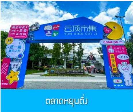
ตลาดหยุนต้ง

11.30 น. คินค่าอาหาร 50 หยวน/ท่าน ท่านสามารถเลือกทานอาหารฟาสฟู๊ดหรืออาหารพื้นเมืองในสถานีรถไฟ (2) 12.34 น. นำท่านขึ้นรถไฟความเร็วสูงขบวนที่ G3551 (12.34/17.33) เพื่อเดินทางไปยังเมืองฉางไป่ชาน มณฑลจี๋หลิน 17.33 น. ขบวนรถไฟนำท่านเดินทางถึงสถานีรถไฟเมืองฉางไป่ชาน นำท่านเดินทาง โดยรถบัสสู่ภัตตาคาร เย็น รับประทานอาหารค่ำ ณ ภัตตาคาร (3)