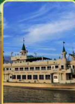
ล่องเรือทะเลสาบโทยะ