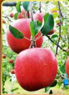
เก็บแอปเปิล