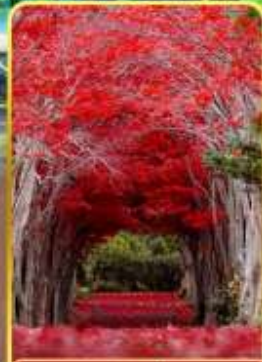
สวนฮิราโอกะ