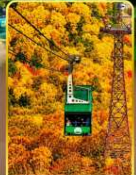
กระเช้าคุโรดากะ