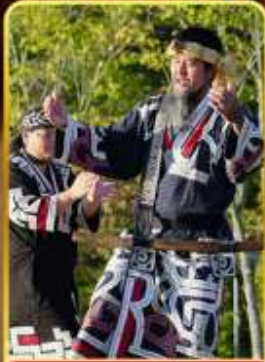
พิพิธภัณฑ์โอนู