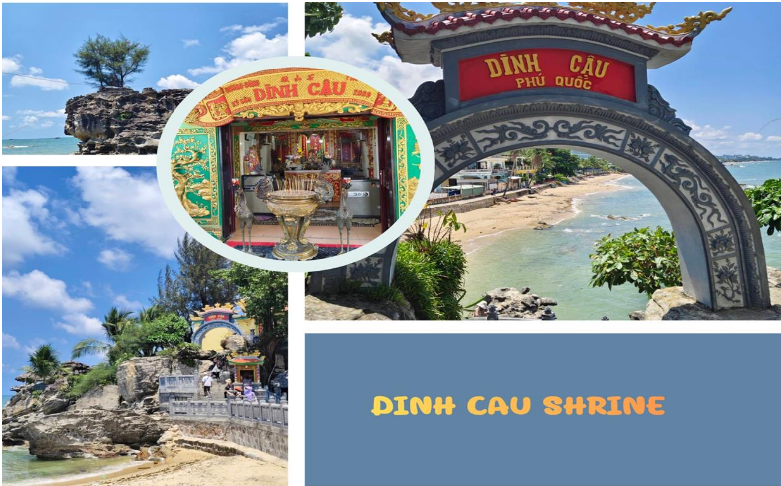
DINH CAU SHRINE

เช้า รับประทานอาหารเช้า ณ ห้องอาหารของโรงแรม ( มื้อที่ 4 )