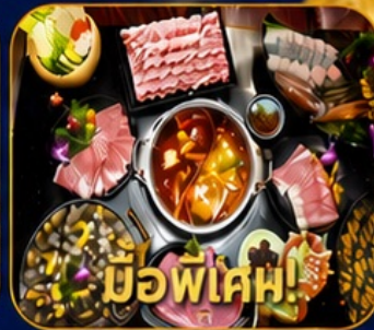
มือพิเศษ! บุฟเฟ่ต์ชาบูสโตร์ฮ่องกง