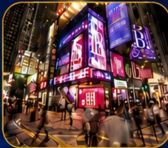
ซอปปิงซินชาฮุย

วัดเจ้าแม่กวนอิมฮ่องกง - ซอปปิงซินชาฮุย - วัดนาจา วัดแชกงหมิว - วัดหวังต้าเซียน